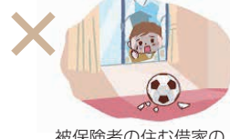
被保険者の住む借家の 窓ガラスの破損

注:スマートフォン、タブレット・ノートパソコン、自動車・バイク(原付含む)、動物、眼鏡・コンタクトレンズ、宝石・貴金属、業務上貸与されたもの、価格が100万円を超えるものなどは借りたものであっても保障の対象外となります。