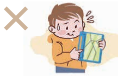
学校から借りたタブレットの破損