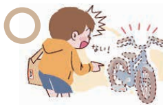
友達から借りた自転車の盗難