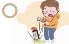
友達から借りたゲーム機の破損