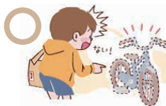
友達から借りた自転車の盗難