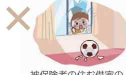
被保険者の住む借家の窓ガラスの破損

注:スマートフォン、タブレット・ノートパソコン、自動車・バイク(原付含む)、動物、眼鏡・コンタクトレンズ、宝石・貴金属、業務上貸与されたもの、価格が100万円を超えるものなどは借りたものであっても保障の対象外となります。