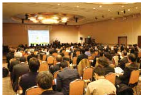
イノベーションサミット2026 会場の様子