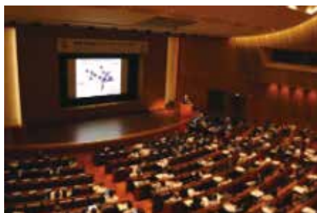
イノベーションフォーラム2025 会場の様子

「全世代PJ最前線『若者が健康未来を変える』」では、弘前大学生協学生委員会より、大学生協でのQOL健診の取り組みが報告されました。また、「社会実装戦略最前線」では、COI-NEXTの参画企業として、青森県生協連とともに、コープ共済連より社会実装の状況についての報告をおこないました。