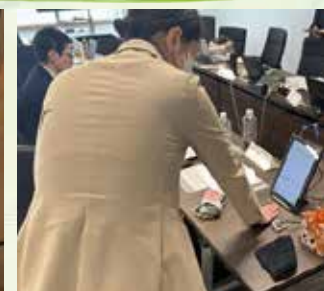
市民生活協同組合ならコープ